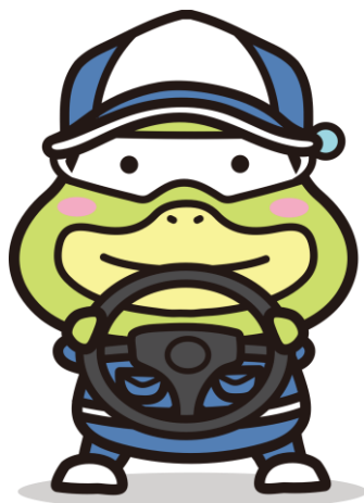
労働基準局広報キャラクター たしかめたん